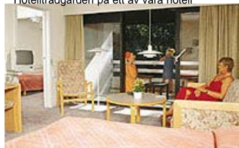
Ett av våra bekväma rum