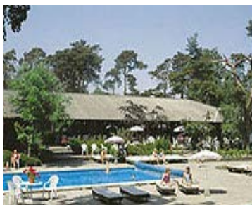
Ett av våra hotell, beläget vid stranden. Alla rum har badrum, pentry, radio och TV, balkong eller terrass med möbler