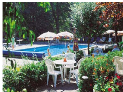
Hotellträdgården på ett av våra hotell